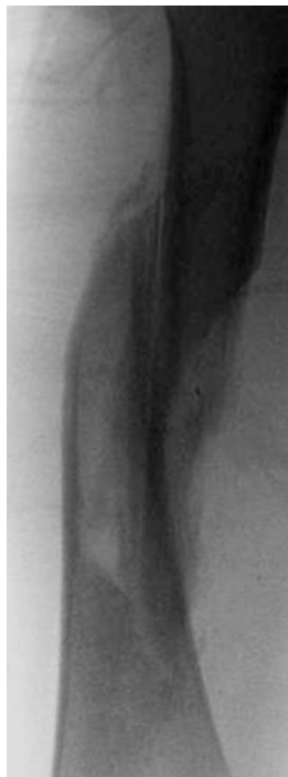
Imagen en detalle del callo óseo de la fractura de fémur a las tres semanas