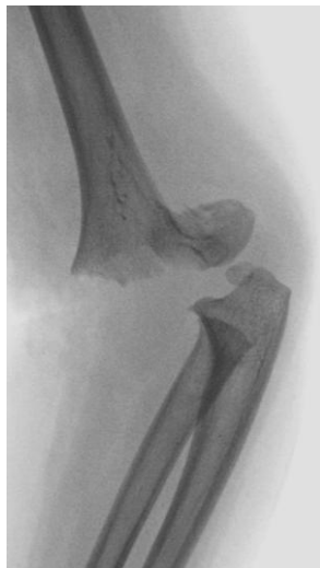
Paciente de 9 meses de edad con fractura epifisiolisis distal de húmero

En otras ocasiones solo se precisa de la inmovilización adecuada con yeso inguino pédico